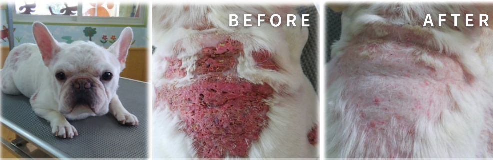
フレンチブルドッグ 10歳

病院に2年通うも改善せず、一般のサロンで炭酸泉温浴を始め、 10日に1度の頻度で半年続けた結果、若く見られるほど綺麗な毛並に！