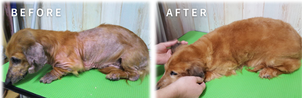
ダックスフンド 14歳

病院に2年通うも改善せず、一般のサロンで炭酸泉温浴を始め、 10日に1度の頻度で半年続けた結果、若く見られるほど綺麗な毛並に！